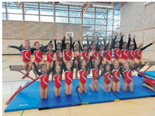
Der Nachwuchs des Turnverein Weingarten.