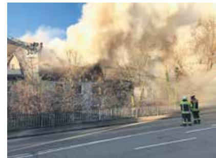
Text: Florian Bodenmüller / Redaktion

langfristig) freien Wohnraum verfügen, können sich im Sekretariat von Weingartens Oberbürgermeister, Clemens Moll, unter 0751 / 405 102 telefonisch melden. Die Stadt vermittelt die Angebote an die Betroffenen weiter.