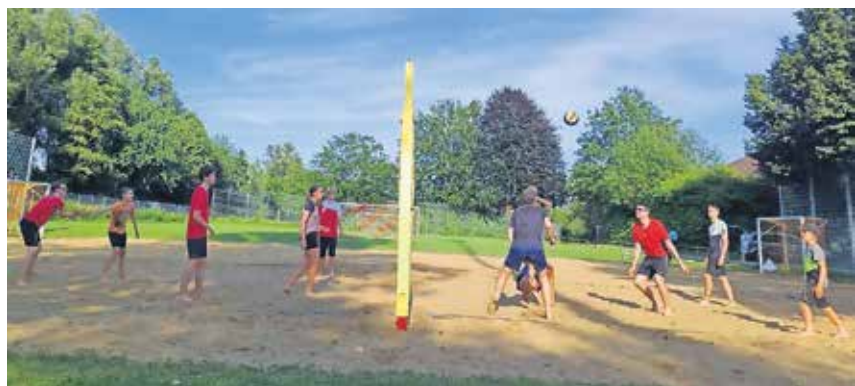
Text und Bild: Philipp Schwarz

Wir freuen uns auf zahlreiche neue und sportbegeisterte Kinder und Jugendliche in der JuSS!