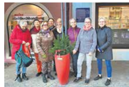
Die Frauen setzen rote Akzente in der Stadt.

Weitere Informationen über die Projekte der Ehrenamtlichen gibt es unter www.stadt-weingarten.de/kraeuter oder per Mail an lebendigesweingarten@web.de .