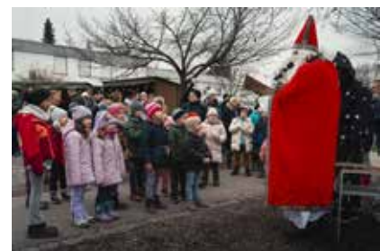
Text und Bild: Stadtmaking Weingarten

Der Adventsmarkt wurde so zu einem gelungenen Start in die Vorweihnachtszeit und begeisterte Jung und Alt gleichermaßen.