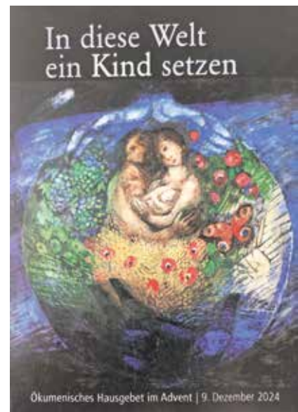
Ökumenisches Hausgebet im Advent | 9. Dezember 2024