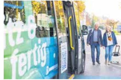
Schnell und unkompliziert durch das Schussental - das verspricht das MOBI-Angebot der TWS in Kooperation mit den Städten Ravensburg und Weingarten.

Bei Rückfragen können sich Fahrgäste per Email an mobil@tws.de, telefonisch unter 0751 / 80 41 130 oder an jedes Kundencenter der TWS wenden. Weitere Informationen zum Angebot sind online unter www.ravensburg.mobi verfügbar.