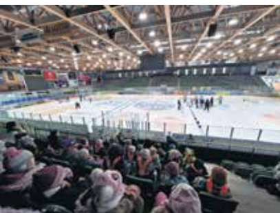
Texte: Sarah Krause

Was für ein Highlight, die Profis mal aus der Nähe sehen zu können. Bevor es nach Hause ging, erhielt jedes Kind eine Freikarte für ein Spiel des EVR. Vielen Dank an die Towerstars für dieses tolle Erlebnis.