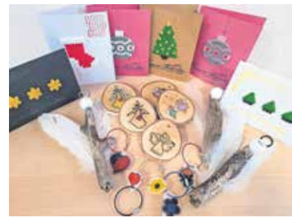
Eine Auswahl der gemeinschaftlich gebastelten Geschenkartikel, die am St.-Lioba-Verkaufsstand angeboten werden.